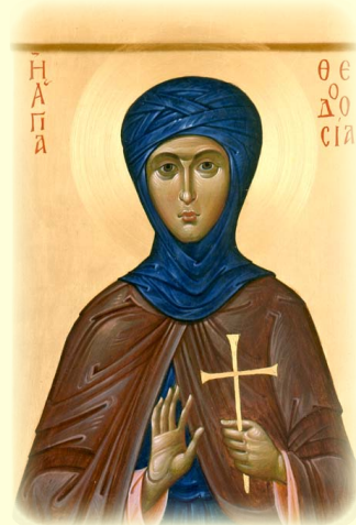
Ἡ Ἁγία Ὁσιομάρτυς Θεοδοσία ἡ Κωνσταντινουπολίτισσα