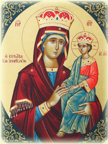
Σύναξις τῆς Ἱερᾶς Εἰκόνος τῆς Ὑπεραγίας Θεοτόκου, τῆς ἐπονομαζομένης «Ἡ Ἐγγυῆτρια τῶν Ἀμαρτωλῶν». (βλ. ἐδῶ)