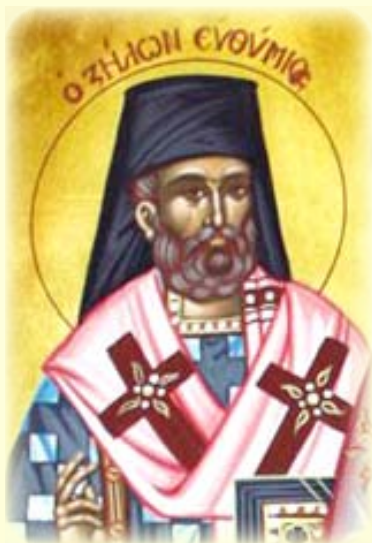
Ὁ Ἅγιος Ἱερομάρτυς Εὐθύμιος, Ἐπίσκοπος Ζήλων