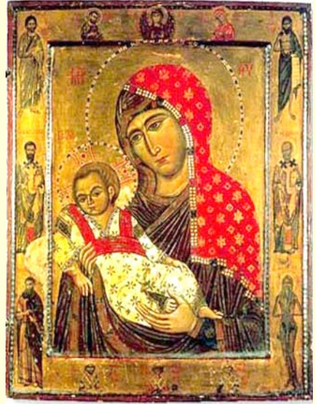
Σύναξις τῆς Ἱερᾶς Εἰκόνος τῆς Ὑπεραγίας Θεοτόκου, τῆς ἐπονομαζομένης «Ἄγρυπνον Ὄμμα»