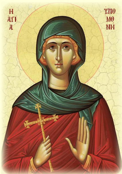
Ἡ Ὁσία Ὑπομονή