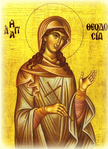
Ἡ Ἁγία Παρθενομάρτυς Θεοδοσία, ἐκ Τύρου καὶ ἐν Καισαρεία τῆς Παλαιστίνης μαρτυρήσασα