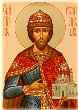
Ὁ Ἅγιος Ῥωμανός, Ἡγεμὼν τοῦ Ριαζάν (Ρωσία)