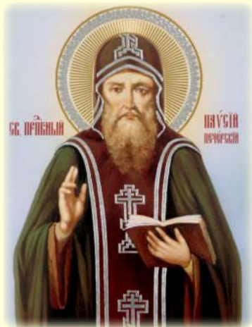
Ὁ Ὁσιος Παῖσιος ὁ ἐν τῇ Ἱ. Λ. τῶν Σπηλαιῶν τοῦ Κιέβου