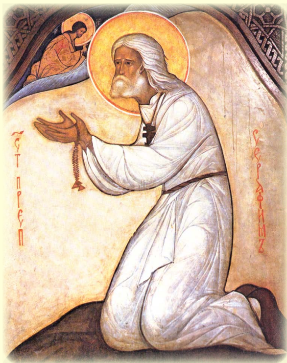
Ἀνακομιδὴ τῶν τιμίων Λειψάνων τοῦ Ὁσίου Σεραφεῖμ τοῦ Σάρωφ (βλ. ἐδῶ , ἐδῶ , ἐδῶ καὶ ἐδῶ )