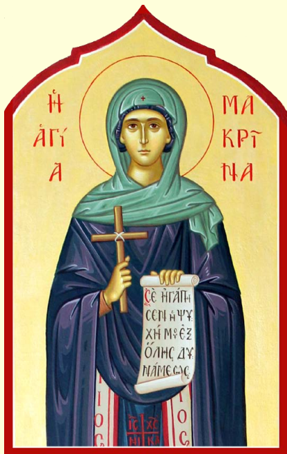
Ἡ Ὁσία Μακρίνα, Ἀδελφὴ τοῦ Μεγάλου Βασιλείου