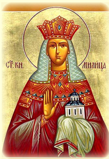
Ὁ Ἅγιος Στέφανος, Ἡγεμὼν τῆς Σερβίας καὶ ἡ Μήτηρ αὐτοῦ Μιλίτσα