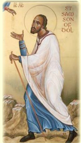
Ὁ Ἅγιος Σαμψών, Ἐπίσκοπος Ντόλ (Γαλλία, βλ. ἐδῶ )