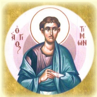
Ὁ Ἅγιος Ἀπόστολος καὶ Διάκονος Τίμων ἐκ τῶν Ὁ'.