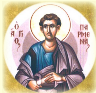
Ὁ Ἅγιος Ἀπόστολος καὶ Διάκονος Παρμενάς ἐκ τῶν Ὁ'.