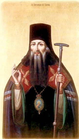
Ὁ Ἅγιος Πιτιρίμ, Ἐπί-σκοπος Ταμπὼβ (Ρωσία)