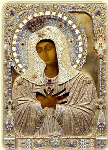
Σύναξις τῆς Ἱερᾶς Εἰκόνοσ τῆς Ὑπεραγίας Θεοτόκου, τῆς ἐπονομαζομένης «Παναγία τῆς Κατανύξεωσ» ἐν τῇ Ἱερᾷ Μονῇ τοῦ Ντιβέγιεβο (Ρωσία) (Ἡ αὐθεντικὴ Εἰκόνα, ἡ ὁποία εὑρίσκεται ἐν τῇ ἀνωτέρω Ἱερᾷ Μονῇ)