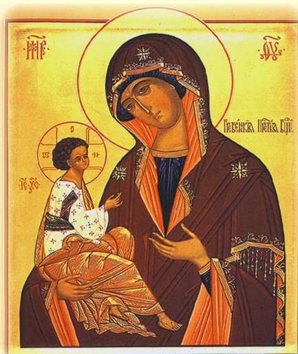
Σύναξις τῆς Ἱερᾶς Εἰκόνοσ τῆς Ὑπεραγίας Θεοτόκου, τῆς ἐπονομαζομένης «Παναγία τοῦ Γκρέμπεν»