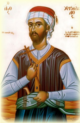
Ὁ Ἅγιος Νεομάρτυς Χριστόδουλος, ὁ ἐκ Κασσάνδρας καὶ ἐν Θεσσαλονίκῃ μαρτυρήσας