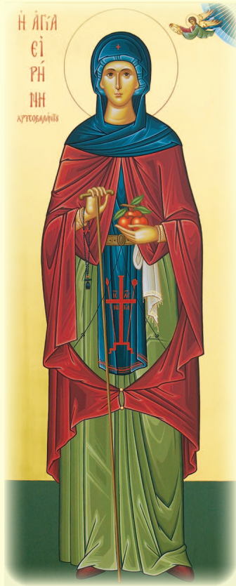
Ἡ Ὁσία Εἰρήνη, Ἡγουμένη τῆς Ἱερᾶς Μονῆς Χρυσοβαλάντου (βλ. ἐδῶ)