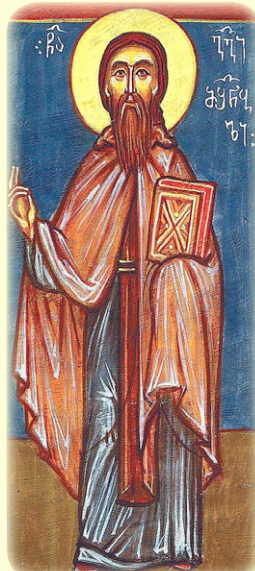
Ὁ Ὅσιος Γεώργιος, ὁ Ἰβηρίτης