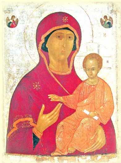
Σύναξις τῆς Ἱερᾶς Εἰκόνοσ τῆς Ὑπεραγίας Θεοτόκου, τῆς ἐπονομαζομένης «Ἡ Ὁδηγήτρια τοῦ Σμολένσκ»