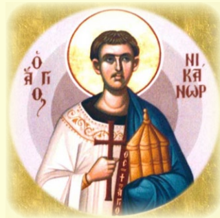
Ὁ Ἅγιος Ἀπόστολος καὶ Διάκονος Νικάνωρ ἐκ τῶν Ὁ'.