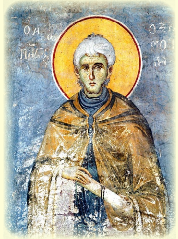
Ὁ Ὅσιος Παῦλος ὁ Ἐρη- ποταμηνός, Κτήτωρ τῶν Ι. Μ. ἐν τῷ Ἄθῳ, Ἐρηποτα- μόν καὶ Ἁγίου Παύλου (Ἁγίου Γεωργίου)