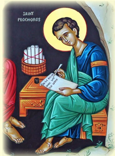
Ὁ Ἅγιος Ἀπόστολος καὶ Διάκονος Πρόχορος ἐκ τῶν Ὁ'.