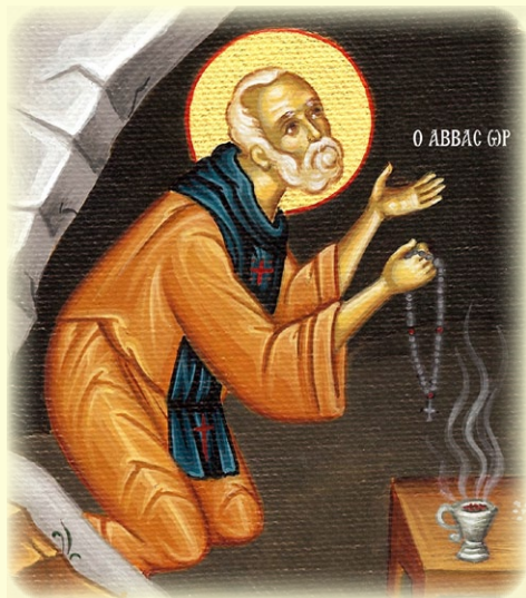
Ό Όσιος Ήφρ (βλ. έδω)