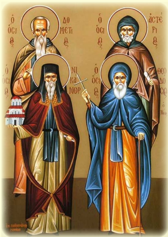
Ὁ Ἅγιος Ὀσιομάρτυς Δομέτιος ὁ Πέρσης, ὁ Ἅγιος Ὀσιομάρτυς Ἀστέριος ὁ Θαυματουργός, ὁ Ὄσιος Νικάνωρ ὁ Θαυματουργός, καὶ ὁ Ὄσιος Θεοδοσίος ὁ Νεός, ὁ Ἰαματικὸς