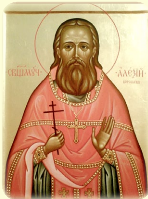
Ὁ Ἅγιος Νέος Ἱερο- μάρτυς Ἀλέξιος (Βορόμπεβ), ὁ ἐν Ῥωσία