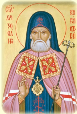
Ἀνακομιδῆ τῶν τιμίων Λειψά- νων τοῦ Ἁγίου Μητροφάνους, Ἐπισκόπου Βορονέζ