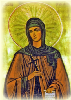
Ἡ Ὁσία Θεοδώρα ἐκ Σίχλα (Ρουμανία)