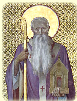
Ό Άγιος Βικτρίκιος, Επί- σκοπος Ρουέν (βλ. έδω)