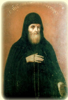
Ὁ Ὅσιος Ποιμῆν, ὁ Νηστευτῆς καὶ Ἡγούμενος τῆς Ἱ. Λ. τῶν Σηλαιῶν τοῦ Κιέβου