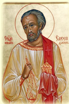
Ὁ Ἅγιος Νεομάρτυρ Ἐλισσαῖος (Στόλδερ), ὁ Διάκονος