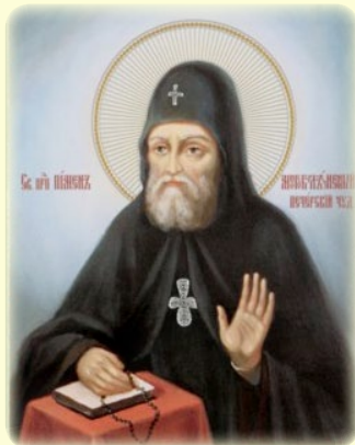
Ὁ Ὅσιος Ποιμῆν, ὁ ἀσθενῆς ἐν τῇ Ἱ. Λ. τῶν Σηλαιῶν τοῦ Κιέβου