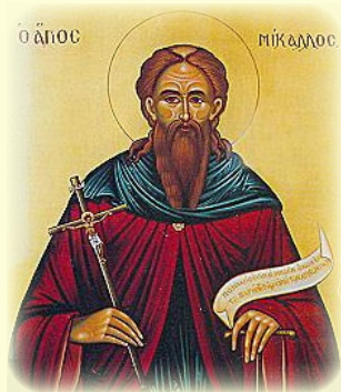
Ὁ Ἅγιος Μικαλλὸς ἐν Κύπρῳ