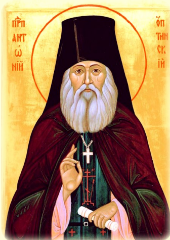
Ό Όσιος Άντωνίος τής Όπτινα (βλ. έδω)