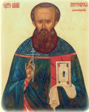
Ὁ Ἅγιος Νέος Ἱερο- μάρτυς Βασίλειος (Ἀμενίτσκυ), ὁ ἐν Ῥωσία