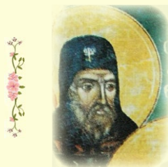
Ό Όσιος Δομέτιος ό Σημειοφόρος.