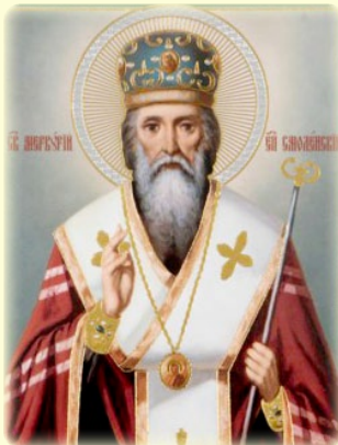
Ὁ Ἅγιος Μερκούριος, Ἐπίσκοπος Σμολένσκ, ὁ ἐν τῇ Ἱ.Λ. τῶν Ση- λαιῶν τοῦ Κιέβου