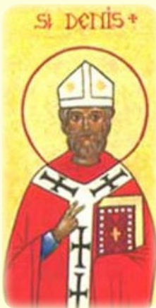
Ὁ Ἅγιος Διονύσιος, Πρῶτος Ἐπί- σκοπος Παρισίων (βλ. ἐδῶ)