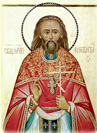
Ὁ Ἅγιος Νέος Ἱερο- μάρτυς Κωνσταντῖνος (Ἀκισιόνωβ), ὁ ἐν Ρωσίᾳ