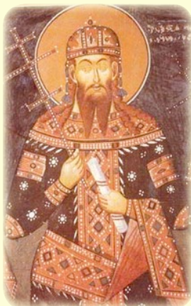
Ὁ Ἅγιος Στέφανος ὁ Τυφλός, Ἡγεμὼν τῆς Σερβίας (βλ. ἐδῶ)