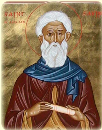
Ὁ Ἅγιος Σαβῖνος, ἓνας ἐκ τῶν Ἀποστόλων τοῦ Λαβεντάν, Ὅρος Πυρενὲ (Γαλλία)