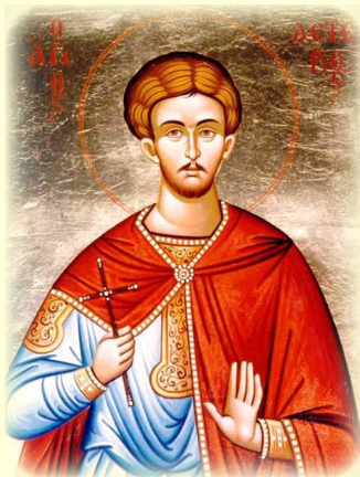
Ὁ Ἅγιος Μάρτυς Ἀστέριος