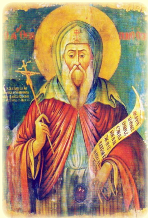
Ὁ Ὅσιος Θεράπων, ὁ ἐν Λυθροδόνη τῆς Κύπρου