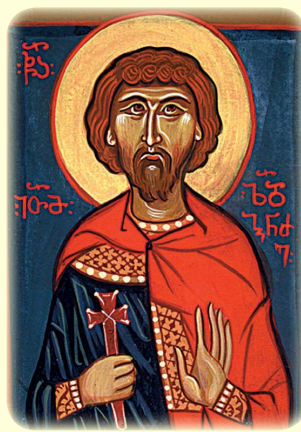
Ὁ Ἅγιος Μάρτυς Ἰωάθαμ (Ζεδγενίδζε) ἐξ Ἰθρίας