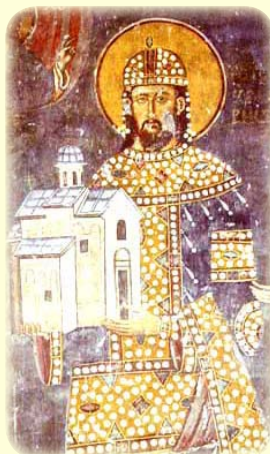
Ὁ Ἅγιος Δραγουτίν, Βασιλεὺς τῆς Σερβίας, ὁ ἐν τῷ Ἁγίῳ Σχήματι μετονομασθεὶς Θεόκτιστος