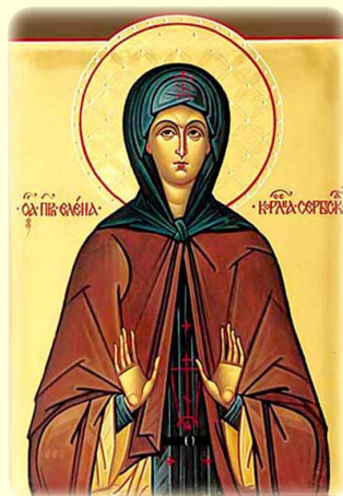
Ἡ Ἅγία Ἐλένη, Βασίλισσα τῆς Σερβίας, ἡ ἐν τῷ Ἁγίῳ Σχήματι μετονομασθεῖσα Ἐλισάβετ