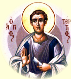
Ὁ Ἅγιος Ἀπόστολος Τέρτιος, ἐκ τῶν Ὁ, Ἐπίσκοπος Ἰκονίου