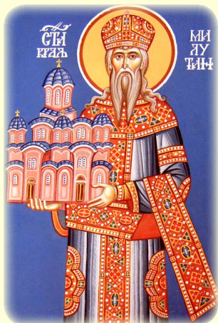
Ὁ Ἅγιος Στέφανος Σ' Μιλούτιν, Βασιλεὺς Σερβίας (βλ. ἐδῶ)