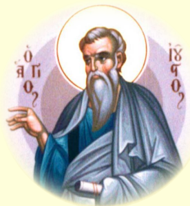
Ὁ Ἅγιος Ἀπόστολος Ἰουῆτος, ἐκ τῶν Ὁ, Ἐπίσκοπος Ἐλευθερουπόλεως