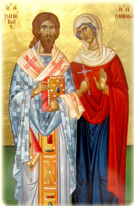
Οἱ Ἅγιοι Μάρτυρες Ζηνόβιος καὶ Ζηνοβία, οἱ Αὐτάδελφοι ἐκ Κιλικίας