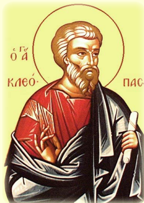
Ὁ Ἅγιος Ἀπόστολος Κλεόπας, ἐκ τῶν Ὁ.