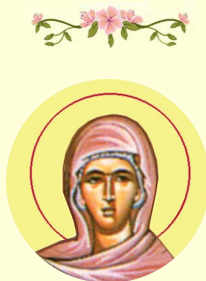
Ἡ Ἅγία Μάρτυς Εὐτροπία