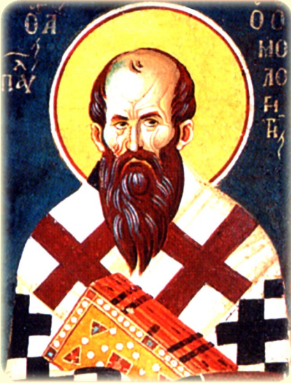
Ὁ Ἅγιος Ἱερομάρτυς Παῦλος ὁ Ὁμολογητής, Ἀρχιεπίσκοπος Κωνσταντινουπόλεως