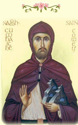
Ὁ Ὅσιος Κόουεῖ ἐν Πορταφέρρου, Ἡγού- μενος ἐν τῇ Ἱ.Μ. ἐν Μοβιλλ (Ἱρλανδία)