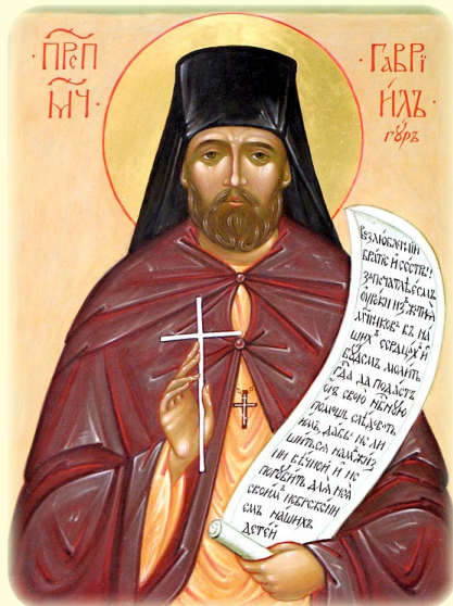
Ὁ Ἅγιος Νέος Ὁσιομάρτυς Γαβριήλ (Γούρ), ὁ ἐν Ρωσία