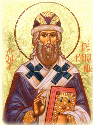
Ὁ Ἅγιος Γερμανός, Ἀρχιεπίσκοπος Καζάν