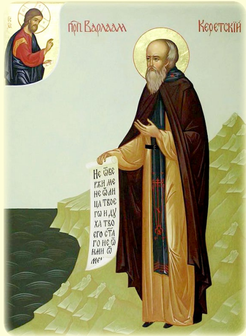
Ὁ Ὅσιος Βαρλαάμ, ὁ ἐν Κέρετς-Καρέλια (Ρωσία, βλ. ἐδῶ )