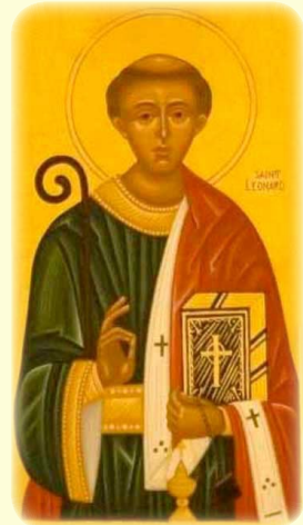
Ὁ Ἅγιος Λεονάρδος, ὁ Ἄναχωρητῆς ἐν Λιμὸς (Γαλλία)