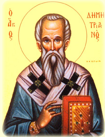
Ὁ Ἅγιος Δημητριανός, Ἐπίσκοπος Χύτρων (Κύπρος)