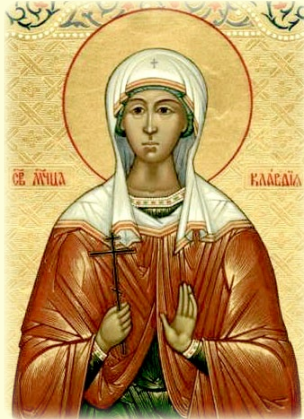
Ἡ Ἁγία Μάρτυς Κλαυδία, ἡ ἐν Ἀγκύρᾳ