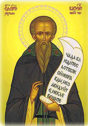
Ὁ Ὅσιος Βαρλαάμ, ὁ ἐν Χοντίνῃ