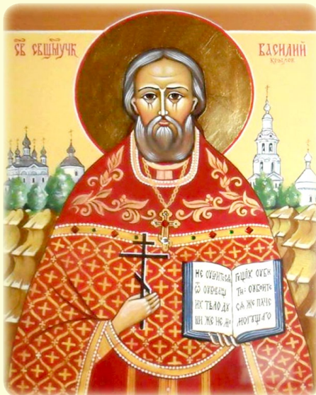
Ὁ Ἅγιος Νέος Ἱερομάρτυς Βασίλειος (Κρυλώβ), ὁ ἐν Ρωσία