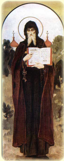
Ὁ Ὅσιος Λουκάς, Οἰκονόμος ἐν τῇ Λαύρα τῶν Σηπλαιῶν τοῦ Κιέβου.