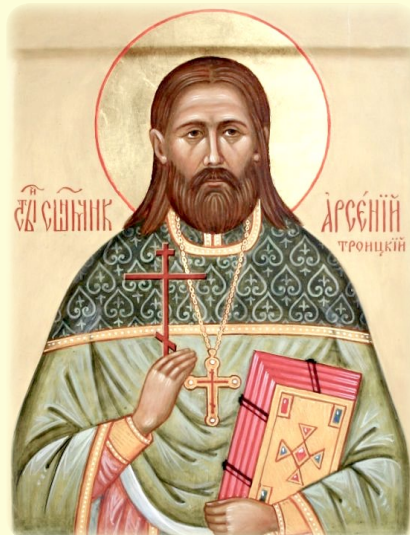
Ὁ Ἅγιος Νέος Ἱερομάρτυς Ἄρσένιος (Τρόϊτσκι), ὁ ἐν Ρωσία