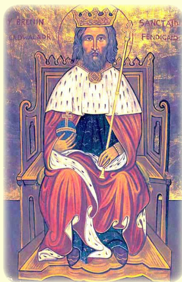
Ὁ Ἅγιος Καδουλαδέρος, ὁ Εὐλογημένος, Βασιλεὺς τῆς Οὐαλλίας