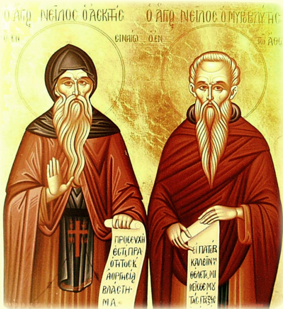
Ὁ Ὅσιος Νείλος ὁ Ἀσκητῆς, ὁ Σιναῖτης καὶ Ὁ Ὅσιος Νείλος ὁ Μυροβλύτης, ὁ ἐν τῷ Ἄθῳ