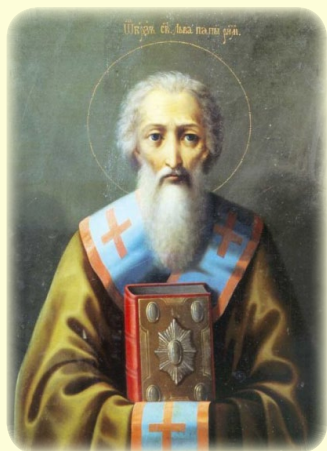
Ὁ Ἅγιος Λέων, ὁ Σπύπης, Πατριάρχης ΚΠόλεως