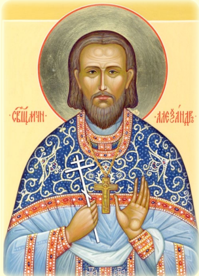
Ο Άγιος Νέος Ίερομάρτυς Αλέξανδρος (Άρχαγγέσκυ), ό έν Ρωσία