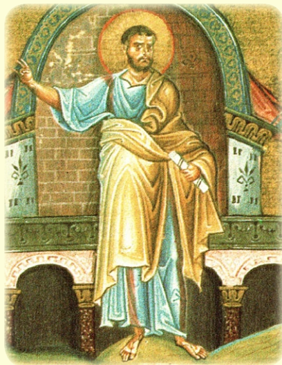
Ὁ Προφήτης Ἰαχιά