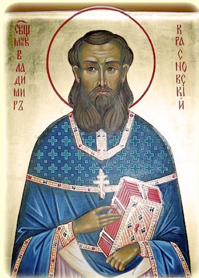
Ο Άγιος Νέος Ίερομάρτυς Βλαδίμηρος (Κρασνώβσκυ), ό έν Ρωσία