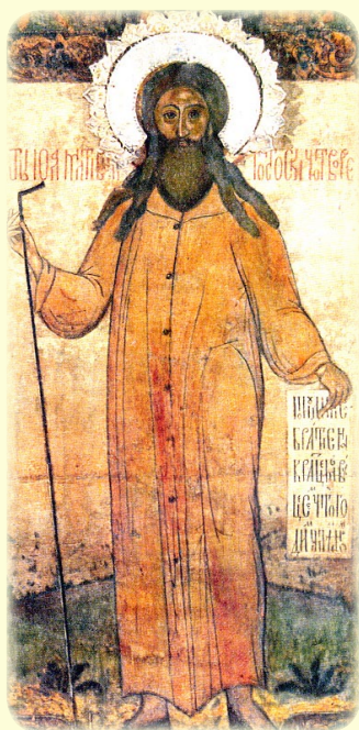
Ὁ Ὅσιος Ἰωάννης, ὁ Δασύτριχος, ὁ διὰ Χριστὸν Σαλὸς ἐν Ροστοβία