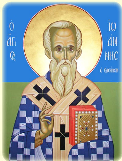
Ὁ Ἅγιος Ἰωάννης ὁ Ἐλεήμων, Ἀρχιεπίσκοπος Ἀλεξανδρείας