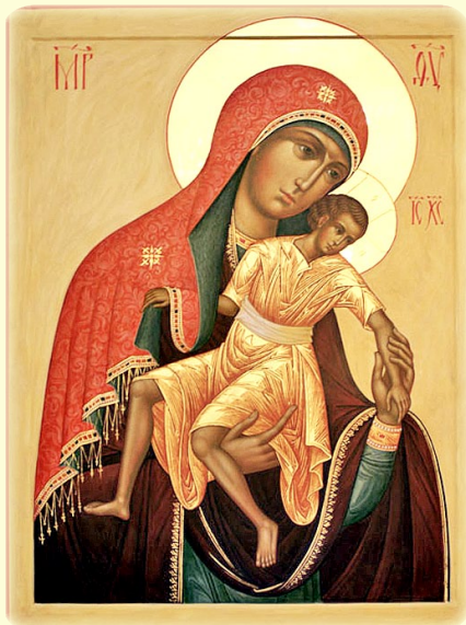
Σύναξις τῆς Ἱερᾶς Εἰκόνος τῆς Ὑπεραγίας Θεοτόκου, τῆς ἐπονομαζομένης «Ἡ Ἐλεούσα»