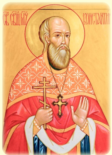
Ο Άγιος Νέος Ίερομάρτυς Κωνσταντίνος (Ούσπένσκυ), ό έν Ρωσία