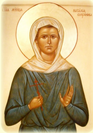
Ἡ Ἁγία Νεομάρτυς Ναταλία (Σιλουάνο- βα), ἡ ἐν Ρωσία