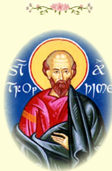
Ὁ Ἅγιος Τρόφιμος, ὁ πρῶτος Ἐπίσκοπος Ἀρελάτης (Γαλλία) (βλ. ἐδῶ)