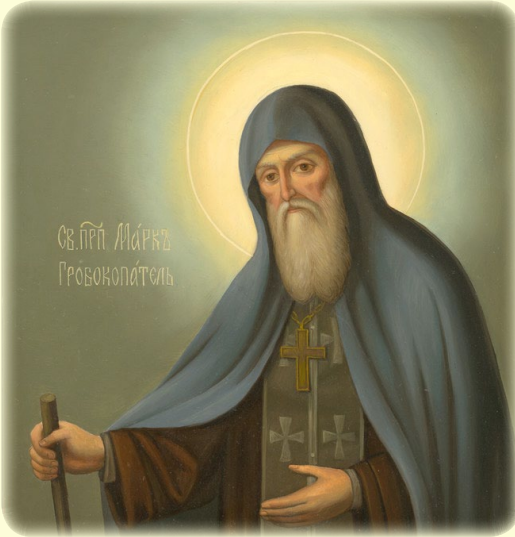
Ὁ Ὅσιος Μάρκος ὁ ταφοποιός, τῆς Ἰ.Λ. τῶν Σηηλαίων τοῦ Κιέβου