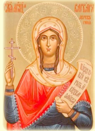
Ἡ Ἁγία Νεομάρτυς Βαρβάρη (Δερεβιάγι- να), ἡ ἐν Ρωσία