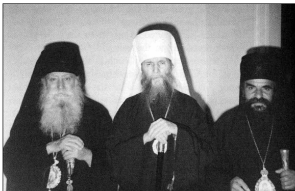
Ὁ Μητροπολίτης Φιλάρετος με τοὺς Μητροπολίτας Κορινθίας Κάλλιστο καὶ Κιτίου Ἐπιφάνιο στὴν Νέα Ὑόρκη τὸ ἔτος 1971.

Ἑλλήνων τοῦ Πατρίου (Γ.Ο.Χ.) ὑπὸ τὸν τότε Ἀρχιεπίσκοπο Αὐξέντιο.