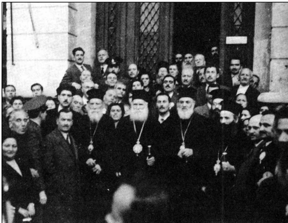
Ὁ πρῶην Φλωρίνης Χρυσόστομος μὲ Ἀρχιερεῖς καὶ Λαϊκοὺς Ὀρθοδόξους σὲ Ἐκδήλωσι στὴν Ἀθήνα περὶ τὸ ἔτος 1950.

α3. Οἱ δύο πλευρὲς ἔκτοτε συνέχισαν τὴν κεχωρισμένη πορεία τους καὶ τὸ πλῆγμα γιὰ τὸν κοινὸ Ἀγῶνα, ὅπως καὶ ἡ τραγικὴ διαίρεσις Κλήρου καὶ Λαοῦ, ἦσαν ὀδυνηρὰ ἀπὸ κάθε ἄποψι. Σο-