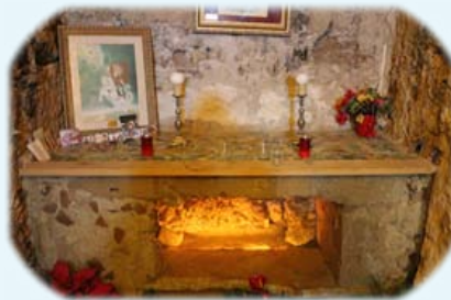
Ὁ Τάφος τοῦ Ἁγίου Ἐφισίου.

Μ ὲ τὴν Χάρι τοῦ Κυρίου μας, τὴν εὐλογία τοῦ Μακαριωτάτου Ἀρχιεπισκόπου μας κ. Καλλινίκου καὶ ὑπὸ τὴν Σκέπη τῆς Θεοτόκου, πραγματοποιήθηκε μία ιδιαίτερα σημαντικὴ καὶ ἐλπιδοφόρος ποιμαντικὴ ἐπίσκεψις στὸ εὐλογημένο Νησί τῆς Σαρδινίας στὴν Ἰταλία, ἀπὸ 14ης ἕως καὶ 17ης Ἰανουαρίου 2017 ἐκ. ἡμ., ἡ πρώτη μετὰ τὴν πρὸς Κύριον ἐκδημία τοῦ Ἀειμνήστου Ἐπισκόπου Νόρα κ. Μιχαήλ († 31.8.2016 ἐκ. ἡμ.).