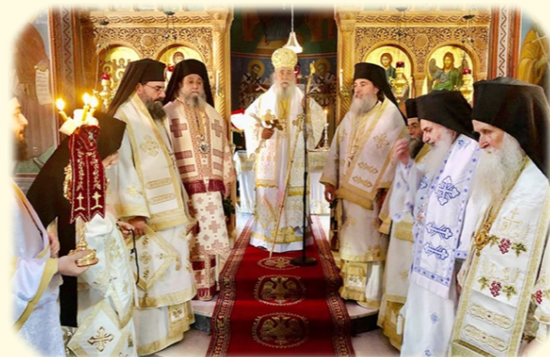
Ὁνομαστήρια τοῦ Μακαριωτάτου Ἀρχιεπισκόπου μας κ. Καλλινίκου 29ῆς Ἰουλίου 2020 ἐκ. ἡμ. Στὴν Ἱερὰ Μονὴ Ἁγίων Ταξιάρχων, Ἀθίκια Κορινθίας.