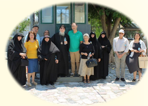
ΙΔ΄ Προσκύνημα - Ἐπίσκεψις στὸ Κατάστημα Κράτησης Νέων Βόλου (150 Κρατούμενοι) Δευτέρα, 16ῆς Ἰουνίου 2020 ἐκ. ἡμ. Συνεχίζεται ἡ συμπαράστασις, στοὺς Κρατούμενους Ἀδελφούς μας, παρὰ τὰ περιοριστικὰ μέτρα ἐπικοινωνίας.