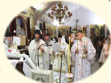
Μνήμη τῆς Ἁγίας Ὁσιοπαρθενομάρτυρος Παρασκευῆς 26ῆς Ἰουλίου 2020 ἐκ. ἡμ. Στὴν ἱστορικὴ ὁμώνυμη Ἱερὰ Μονή, Ἀχαρναὶ Ἀττικῆς.