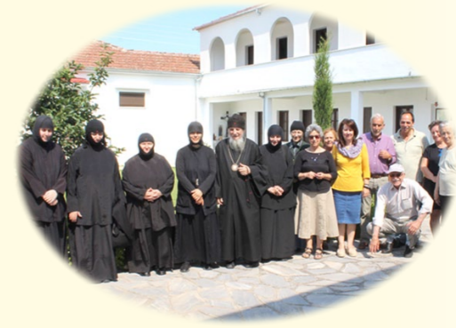
Προσκύνημα στὴν Ἱερὰ Μονὴ Ζωοδόχου Πηγῆς Δευτέρα, 16ῆς Ἰουνίου 2020 ἐκ. ἡμ. Στὸν Ριζόμυλο Βελεστίνου, ὅπου συνεχίζονται οἱ ἐργασίες ἀνακαινίσεως.