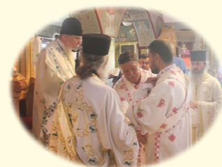
Μνήμη τῶν Ἁγίων καὶ Ἱαματικῶν Ἀναργύρων 1ῆς Ἰουλίου 2020 ἐκ. ἡμ. Στὸν ὁμώνυμο Ἱερὸ Ναὸ στὴν Ἐλευσίνα (δεξιὰ). • Χειροθεσία Ὑποδιακόνου (ἀριστερά), 17ῆς Αὐγούστου 2020 ἐκ. ἡμ.