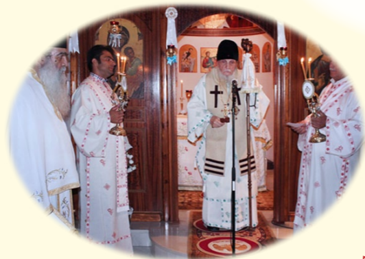
19ῆς Ἰουνίου 2020 ἐκ. ἡμ. Ἄγρυπνία πρὸς τιμὴν τοῦ Ἁγίου Ἰωάννου Σαγγᾶς, στὴν Ἱερὰ Μονὴ Ἁγίων Ἀγγέλων, Ἀφίδναι Ἀττικῆς.

«Βόσκει τὰ Ἄρνια Μου!... Ποίμηναι τὰ Πρόβατά Μου!... Βόσκει τὰ Πρόβατά Μου!...»