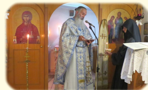
Ἁγίας Μαρίας Μαγδαληνῆς 22ας Ἰουλίου 2020 ἐκ. ἡμ. Στὸ ὁμώνυμο Ἦσυχαστήριον, Καλαμπάκα.