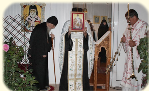
Ἁγίου Γλυκερίου Ὁμολογητοῦ 15ῆς Ἰουνίου 2020 ἐκ. ἡμ. Στὴν Ἱερὰ Μονὴ Ἁγίων Ἀγγέλων, Ἀφίδναι Ἀττικῆς.