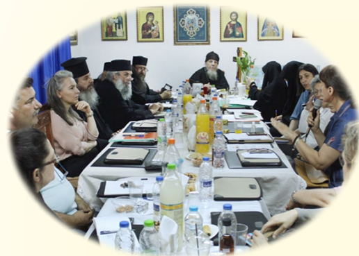
Γενική Ὄργανωτική Σύναξις Ἀπολογισμὸς ΙΓ΄ Περιόδου καὶ προγραμματισμὸς ΙΔ΄ Περιόδου Φυλῆ Ἀττικῆς, 27ῆς Ἰουνίου 2020 ἐκ. ἡμ. Ἐμπειρίες εὐλογημένης Συν-Διακονίας, στὰ Γραφεῖα τῆς Ἱερᾶς Μητροπόλεώς μας.