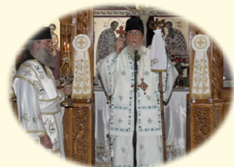
Μνήμη τοῦ Ἁγίου Κοσμᾶ τοῦ Αἰτωλοῦ 24ῆς Αὐγούστου 2020 ἐκ. ἡμ. Ἐπέτειος Κουρᾶς τοῦ Σεβασμ. Μητροπολίτου μας.