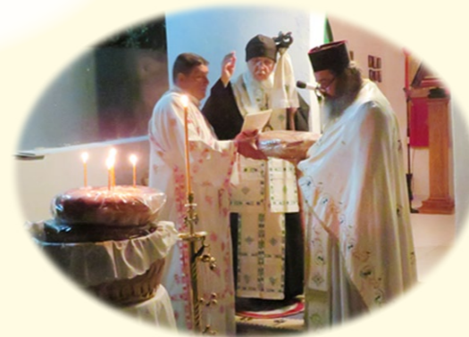
20ῆς Ἰουνίου 2020 ἐκ. ἡμ. Ἄγρυπνία εἰς τὴν Σύναξιν τῆς Ἱερᾶς Εἰκόνας τῆς Παναγίας Ὁδηγητρίας, στὸ ὁμώνυμο Ἦσυχαστήριον, Ἀχαρναὶ Ἀττικῆς.