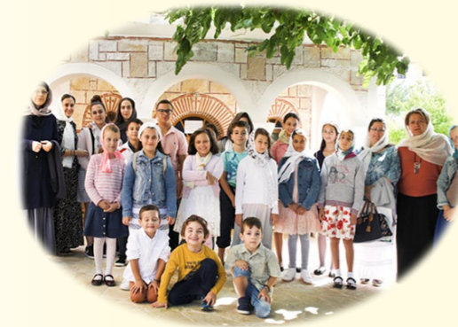
Εὐχὲς καὶ Ἀγιασμὸς ἐπὶ τῇ Ἐνάρξει Σχολικῶν καὶ Κατηχητικῶν Μαθημάτων Περίοδος ΙΔ΄ 2020-2021 Κυριακὴ, 24ῆς Αὐγούστου 2020 ἐκ. ἡμ. «Ἀπὸ Θεοῦ ἄρξασθαι!...».