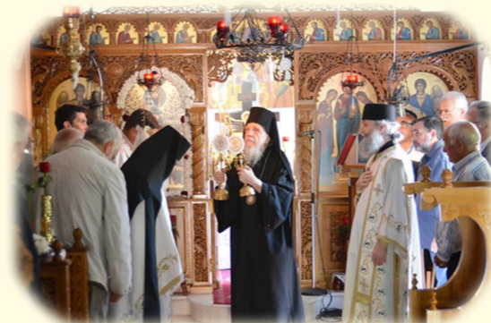
Πανήγυρις τῶν Ἁγίων Πάντων 1ῆς Ἰουνίου 2020 ἐκ. ἡμ. Στὸ ὁμώνυμο Ἦσυχαστήριον στὸ Ἄγρινιο.